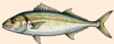
LÍRIO GREATER AMBERJACK